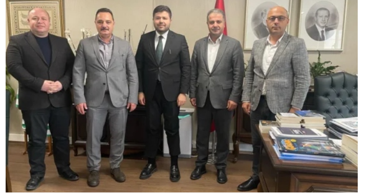
TİMBİR heyetinden RTÜK'e ziyaret