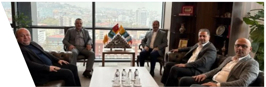
Nisan Ayı Ziyaretleri