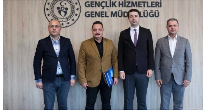
TİMBİR'den Gençlik Hizmetleri Genel Müdürüne ziyaret