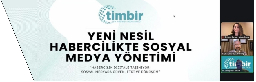
Nisan Ayı Faliyetleri