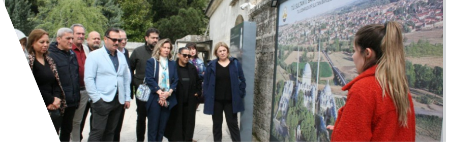
TİMBİR'den Edirne Tarihine Yakın Mercek