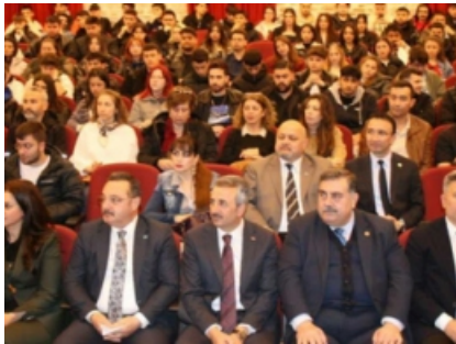
Sivil Toplum Medya Buluşması'na Yoğun İlgisi