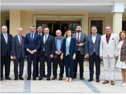
TİMBİR'den Edirne Buluşması