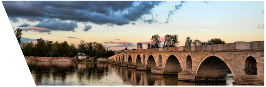
Tarihin Başladığı Yerden Eski Başkentte Edirne'yi Keşfedin